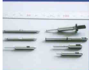
小径ピンゲージ各種